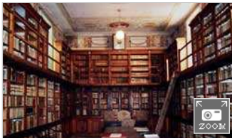
“CulturaItalia”: il Mibac dà l'avvio alla digitalizzazione